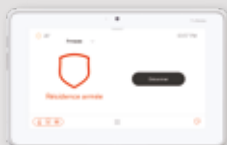
ÉCRAN TACTILE (SANS FIL) DE 7 PO