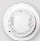
DÉTECTEUR DE FUMÉE