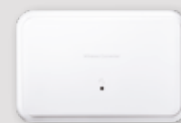
CONVERTISSEUR SYSTÈME CÂBLÉ À SANS-FIL

La ProSeries offre une flexibilité sans précédent et la modularité dont vous avez besoin pour mobiliser vos clients et évoluer en fonction de leurs besoins. Elle propose des solutions de vie branchée « en tout et partout » permettant des transferts et des mises à jour simples, et une expérience parfaitement cohérente entre le matériel et les logiciels. Cela vous permet de gagner plus de clients, de les garder plus longtemps et de générer des profits.