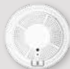
DÉTECTEUR COMBINÉ DE FUMÉE ET MONOXYDE DE CARBONE