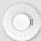
DÉTECTEUR DE CHALEUR