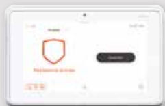
7 PO TOUT-EN-UN