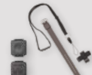
ÉMETTEURS D'URGENCE PERSONNELLE ET MÉDICALE