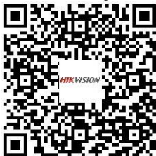
Workstation DS-WSELI-T/(P) Series

Scan the QR codes below to get more information about your product.