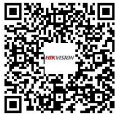
Education Sharing System DS-8108LHFHI-K2