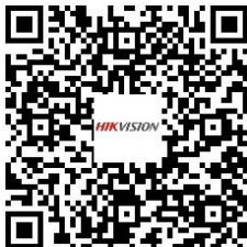
ATM Digital Video Recorder