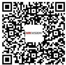
Video Loop Device DS-1TLP16I