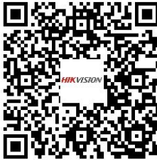
Education Sharing System DS-9604LNI-V/B02