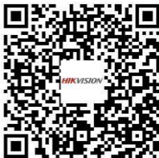
Network Audio/Video Encoder DS-6700 Series