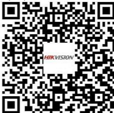
Workstation DS-WSEWI-T/(P) Series