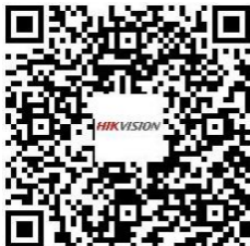
Encoder DS-6700HUHI Series